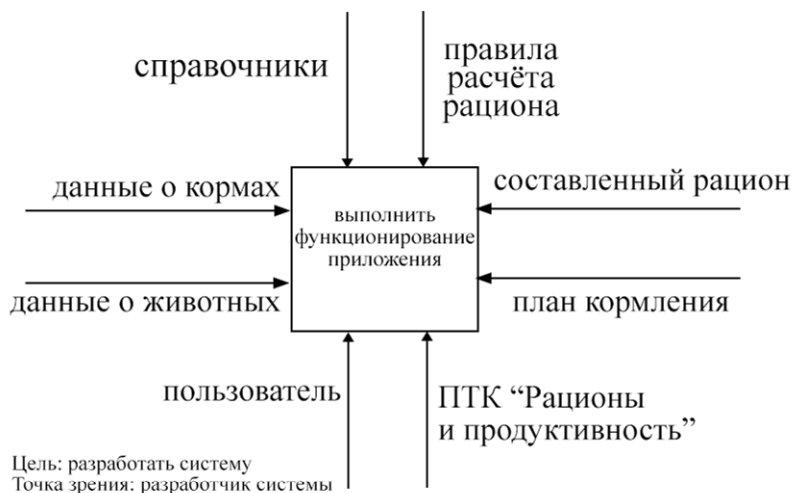
Рис. 2. Контекстная диаграмма работы приложения «Рацион и продуктивность»

Для упрощения восприятия информации по работе приложения на рис. 2 представлена контекстная диаграмма в нотации IDEF0.