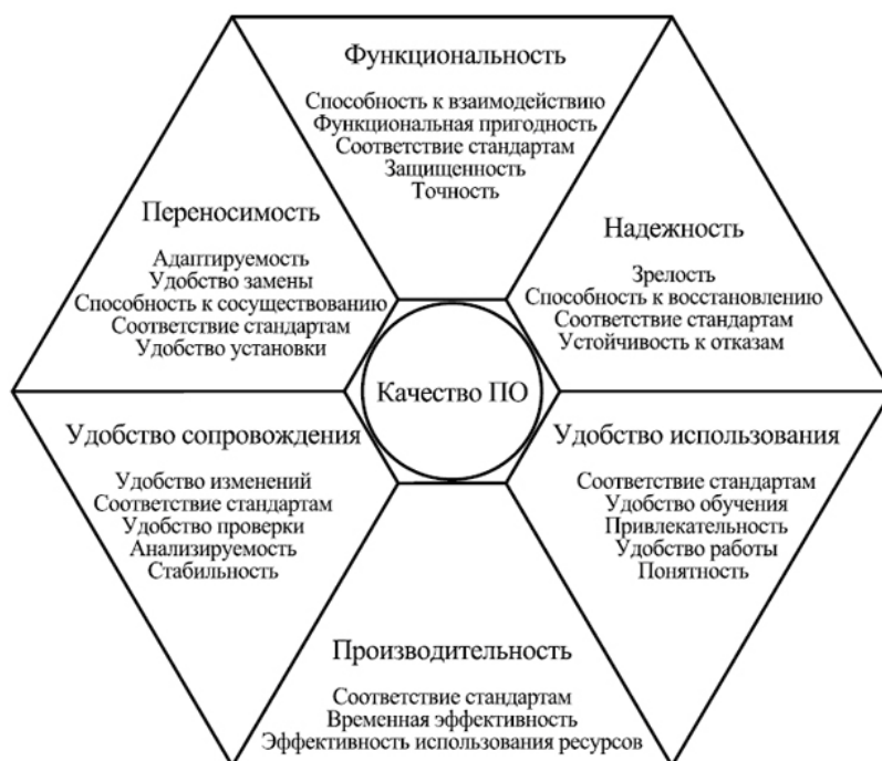
Рис. 1. Факторы и атрибуты внешнего и внутреннего качества программного обеспечения в соответствии с ISO/IEC 9126

Для формирования требований и оценки существующих систем была выбрана модель качества ISO 9126 (рис. 1).