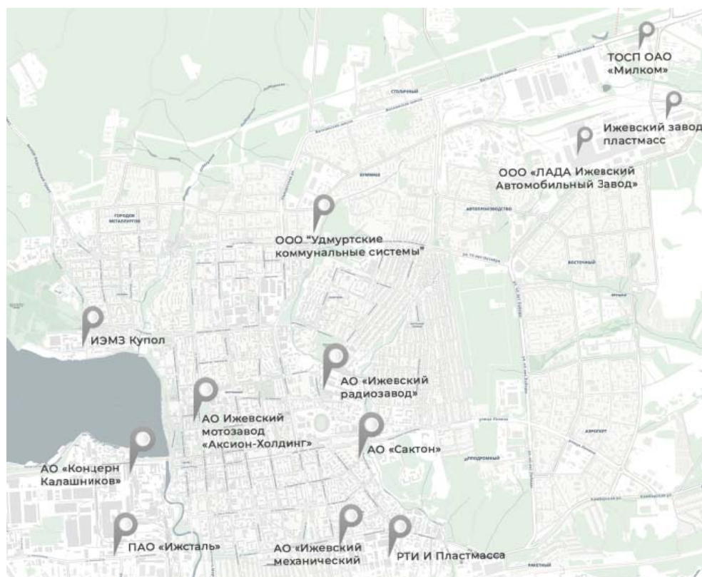
Рис. 1. Основные промышленные предприятия г. Ижевска