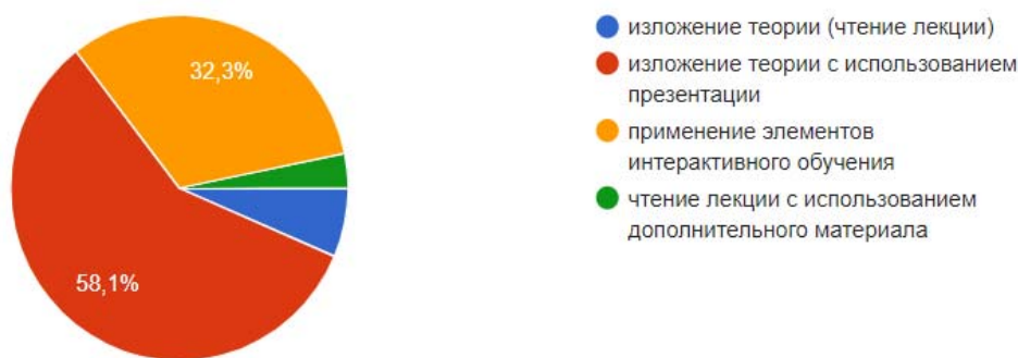
Рис. 2. Мнение обучающихся по вопросу: «Какая форма проведения подачи лекционного материала наиболее эффективна?»

Во время проведения практических занятий применяются разные методы обучения. Это доклады, вопросы для обсуждения, работа с текстом учебной литературы и источника, выполнение творческих заданий (написание эссе) и др. По