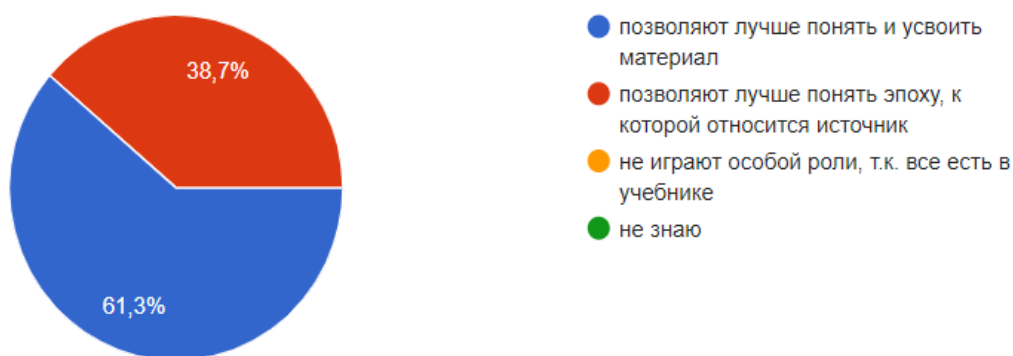
Рис. 4. Мнение респондентов по вопросу: «В чем главная роль использования историко-правовых документов в процессе изучения дисциплины?»

Так, в рамках дисциплины «Становление и развитие органов и учреждений юстиции» обучающимся предлагается изучить и ответить на вопросы по источникам XVIII–XX веков. Например, во время знакомства с такими источниками, как «Краткое изображение процессов или судебных тяжб» (1715 г., март), «О форме суда» (1723 г., ноября 5) обучающиеся должны выделить стадии судебного процесса в рассматриваемый период, его участников, доказывание в судебном процессе и порядок вынесения приговора. По Манифесту 25 июня 1811 г. «Об общем учреждении министерств» следует составить схему «Структура Министерства юстиции в первой половине XIX века». Интересна работа с Судебным уставом от 20 ноября 1864 г. «Учреждение судебных установлений», по которому требуется заполнить таблицу «Судоустройство в Российской империи по судебной реформе 1864 г.», также предлагается составить схемы системы органов власти и управления по Конституциям РСФСР и СССР, определить сферы деятельности, задачи и полномочия Министерства юстиции СССР на основе Постановления Совета Министров СССР от 21 марта 1972 г. N 194 «Об утверждении Положения о Министерстве юстиции СССР».