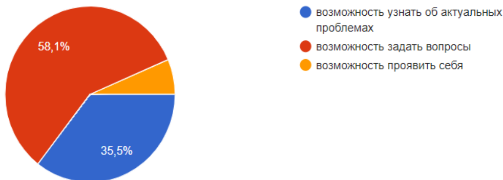
Рис. 5. Мнение респондентов по вопросу: «В чем наибольшая ценность во встрече с практиками?»

Поскольку участниками подобных встреч являются практики, постольку роль подобной формы занятий в образовательном процессе высока: они рассказывают об актуальных проблемах деятельности своих ведомств. Это позволяет активизировать внимание обучающихся, получить более глубокие и предметные ответы на интересующие их вопросы.