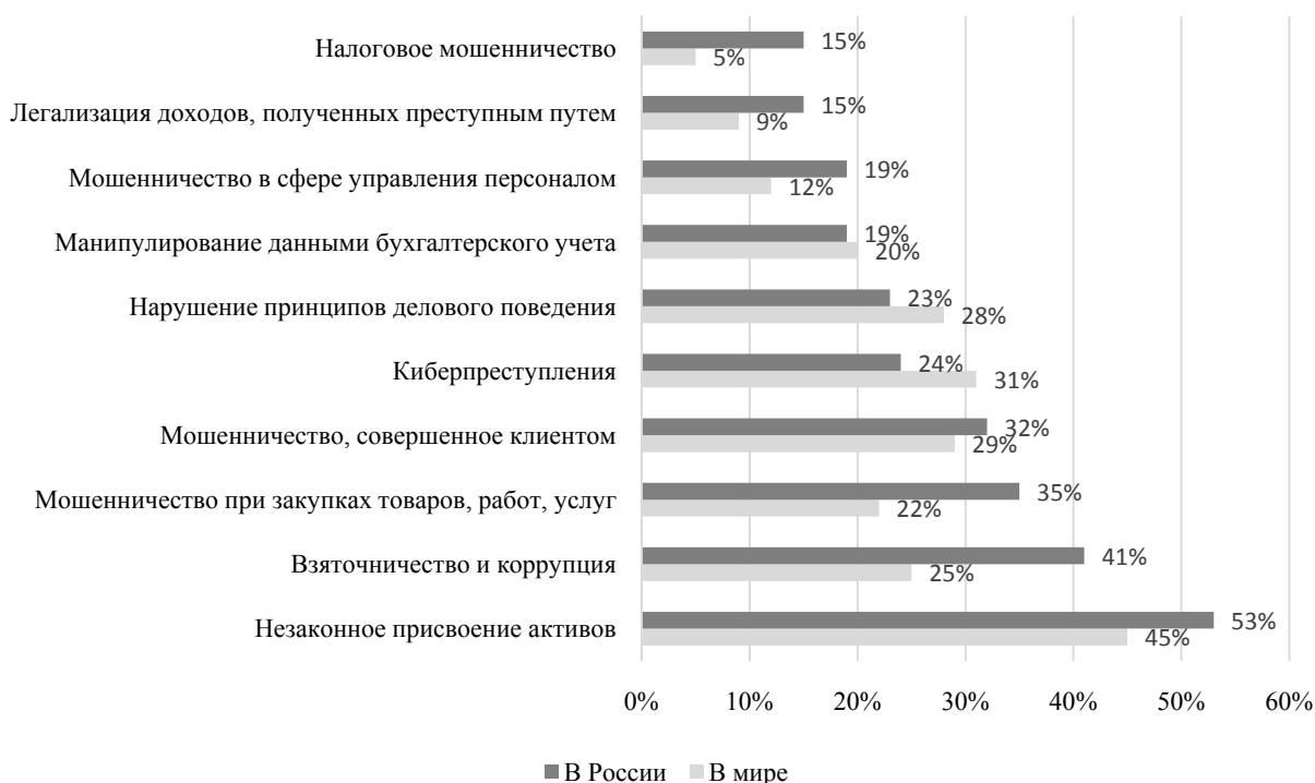
Рис. 2. Основные виды экономических преступлений в России и в мире [11]

активов, взяточничество и коррупция, мошенничество в различных сферах, киберпреступления и др. В России, как и в мире, наиболее распространенным видом преступлений оказалось незаконное присвоение активов: 53 % опрошенных сталкивались с этим видом экономического преступления. Вторым по частоте упоминания является взяточничество и коррупция; 35 % опрошенных предпринимателей в России сталкивались с таким видом преступления, как мошенничество при закупках товаров, работ и услуг, на мировом уровне – 22 %. Этот вид преступлений оказывает негативное влияние и на коммерческий, и на государственный сектора экономики. Наименьшее распространение получили такие виды преступлений, как легализация доходов, полученных преступным путем, и налоговое мошенничество.