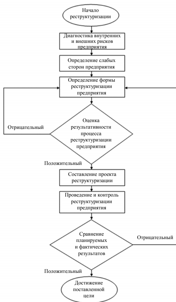
Схема проведения реструктуризации предприятий

мости предприятия затруднительно. Например, подрядные строительные организации – часто унитарные предприятия, осваивающие бюджетные средства, функционирующие в условиях регулирования цен.