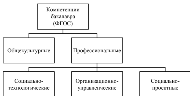
Рис. 1. Совокупность компетенций бакалавра социальной работы

На основании ФГОС ВПО по направлению «Социальная работа» можно представить совокупность компетенций бакалавра (рис. 1).