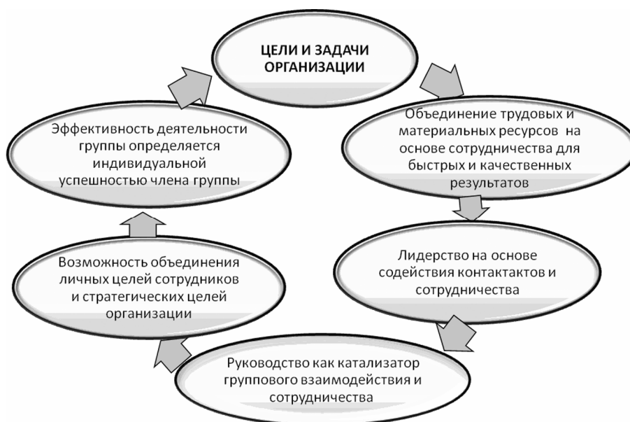
Рис. 2. Достижение цели организации при применении гибкой групповой формы организации труда (ГГОТ)