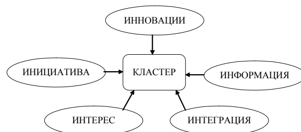
Рис. 1. Концепция «5И» М. Войнаренко

Для создания кластера как жизнеспособной и эффективной организации необходимо наличие пяти основных условий (правило «5И») (рис. 1):