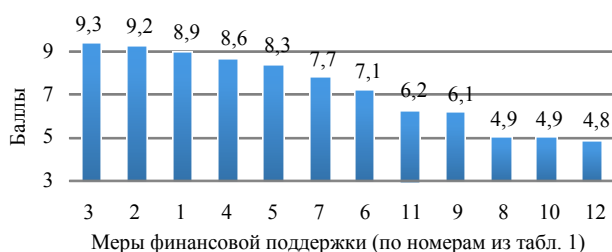
Рис. 1. Результат оценки приоритетности реализации мер финансовой поддержки пилотными регионами

В ходе проведенного исследования получены следующие результаты оценки приоритетности реализации предлагаемых мер финансовой и нефинансовой поддержки индустриальных парков пилотными и остальными регионами, представленные на рис. 1–4. Также выведен средний балл по каждому из предложенных мероприятий (табл. 2).