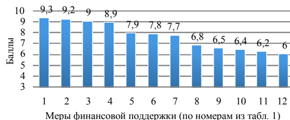
Рис. 2. Результат оценки приоритетности реализации мер финансовой поддержки участниками семинара